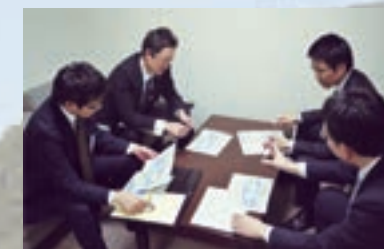
地方創生担当部での会議

地方版総合戦略の策定及び円滑な実施等については、地方公共団体に限らず、産業界・大学・金融機関・労働団体・報道機関が連携していくことが重要であり、地域内での連携を図っています。