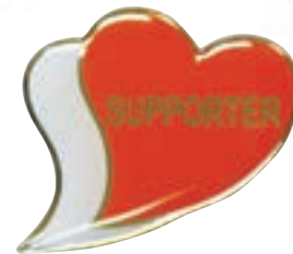
あいサポーターバッジ