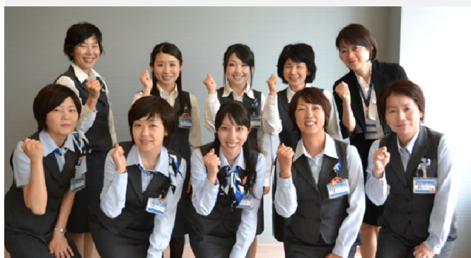
【女性活躍プロジェクト】