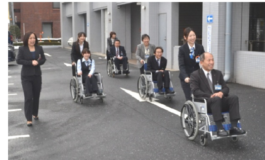
【サービス・ケア・アテンダント実践演習】