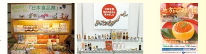
テストマーケティング(香港) 大手食品卸展示商談会へ出品 通販カタログ「地方からの贈り物」

実績! ■台湾の春節中秋ギフトシーズンに向け、出展社商品を提案→述べ 67品目 714セット輸出 ■その他、輸出を希望する出展社のご要望にお応えしています。