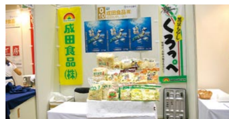
▲1小間出展イメージ