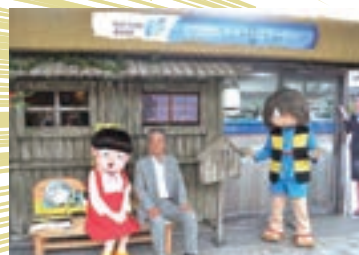
水木しげるロードには、鳥取銀行のATMコーナーがあるほか、鳥取銀行が寄贈したベンチが設置されています。