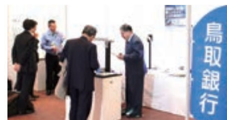
ビジネス・エンカレッジ・フェア2013(大阪市)