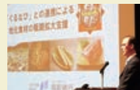
平成26年3月 地域密着型金融に関するシンポジウム事例発表

その取組みに対して、平成26年3月、中国財務局から地域密着型金融の先進的な取組みとして顕彰を受けるとともに、地域密着型金融に関するシンポジウムにて取組事例を発表いたしました。