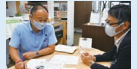
株式会社マツワ様 一般財団法人あしなが育英会様