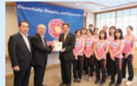
株式会社エヌケーシー様 特定非営利活動法人cheerful鳥取様

私募債発行額の0.2%相当額を上限に、SDGsに取り組む地域の非営利団体に対して、私募債発行企業と当行が連名で寄付を行います。