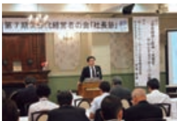
外部講師を招いた講演会

平成24年度は、事業計画立案や日本経済の状況等についての講義・講演会を開催したほか、アジアのハブとして経済成長するシンガポールを視察いたしました。