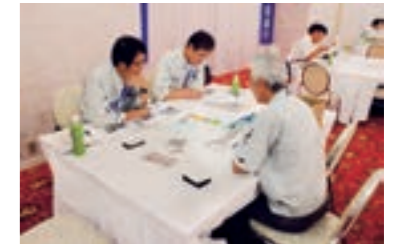
企業発掘商談会 in 津山