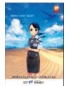
「まんが王国とっとり」応援ポスター