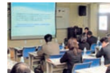
鳥取大学・鳥取銀行連携セミナー