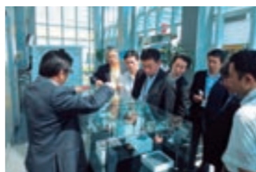
シンガポール現地工場視察