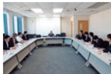
JETROシンガポール事務所による講演会