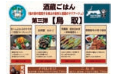
鳥取県食材フェア

自治体との3者連携により、地元生産者の販路拡大を目的とした食材プロデュース活動を展開。第1弾として、地元企業10社が参加し、ぐるなび加盟店のシェフに地元食材を使ったレシピ作成を依頼、飲食店へ提案するためのツール整備に取り組んだ。