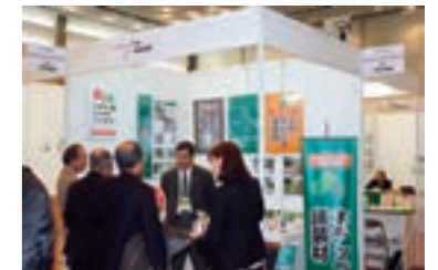
ビジネス・エンカレッジ・フェア2012