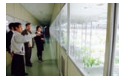
ぐるなびシェフによる生産地ツアー