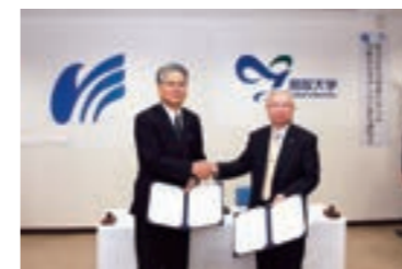
「鳥取大学みらい基金」への寄附(調印式)