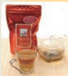
エキナセアハーブティー (大山メディカルハーブ株式会社)