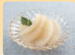
梨コンポート (手づくり梨工房)