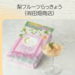
梨フルーツらっきょう (南畑畑商店)