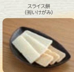
スライス餅 (旬いけがみ)