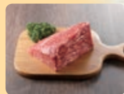
鳥取和牛 (焼お肉の店匠)