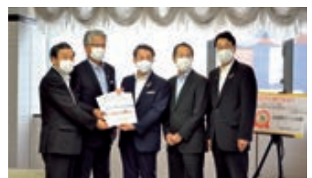
鳥取県が推進する県内経済活性化運動「美味しい 行ってみ隊」にも賛同しています。