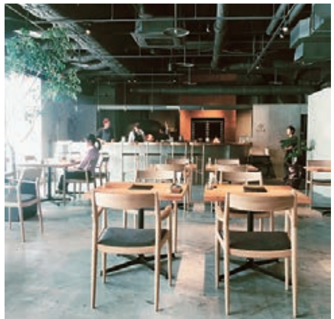
まちづくり融資を活用してリノベーションされた鳥取丸のレストラン「KAEN」。調理スペースには暖炉と薪窯が設置されています。