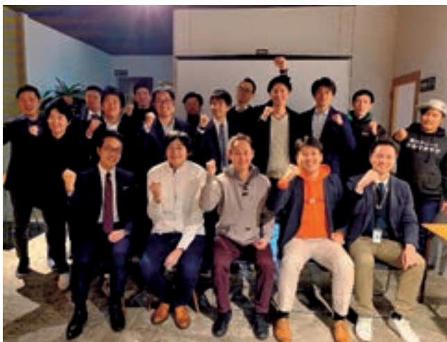
参加者の発表内容の実現に向けて今後も伴走支援を行うことに加え、今回形成された後継者のコミュニティづくりを継続してまいります。