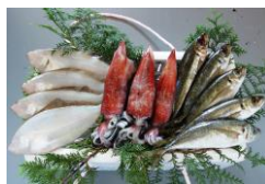
株式会社中村商店 (鳥取市)