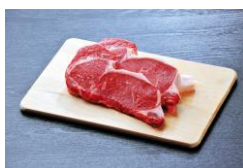
鳥取県畜産農業協同組合 (鳥取市)