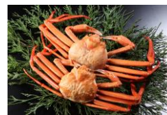
株式会社上野水産 (境港市)