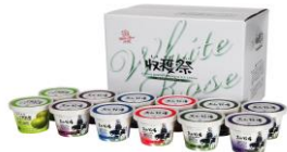
大山乳業農業協同組合 (琴浦町)