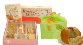
株式会社プレマスペース (鳥取市)