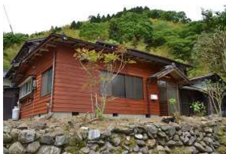
塩上シェアハウス「TeS10」